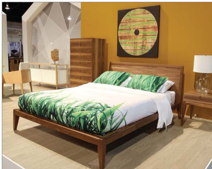
Vignette tendance au SCAR - Collection Pür, 1244 Berkeley Oak.

Organisées sous la forme de 12 décors réalistes, les vitrines tendances comprenaient cette année un revêtement de sol, qui venait s'ajouter aux autres articles d'ameublement.