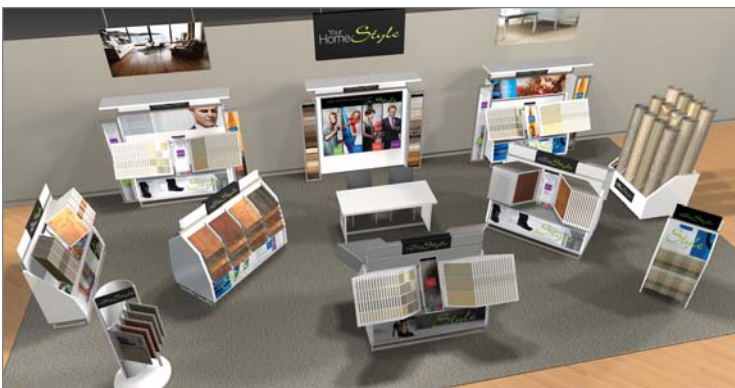
Vue d'ensemble des nouveaux présentoirs YHS

clients préfèrent un look décontracté et artisanal qui évoque la nature. L'équipe de marketing s'est aussi employée à revisiter les trois styles de vie originaux. Cozy Casa est centré sur la famille, comme en témoignent les nombreuses options à prix abordable et fort pratiques, dont les couleurs permettent de créer un intérieur confortable et dynamique. Le look et la fonction se rejoignent dans l'éventail de revêtements Studio Urbano, dont le modernisme s'harmonise avec un style cosmopolite percutant. Quant aux consommateurs plus traditionnels, ils continueront à être attirés par les designs intemporels et huppés de Classik Elegance. Dans le domaine des revêtements de sol, Your HomeStyle demeure le programme pour détaillants indépendants le plus exclusif de Beaulieu Canada et celui qui propose le meilleur assortiment de nos produits. À travers un système de vente axé sur les styles de vie, YHS continue à symboliser une expérience d'achat unique et des plus agréables pour la consommatrice en quête d'un nouveau revêtement de sol. □