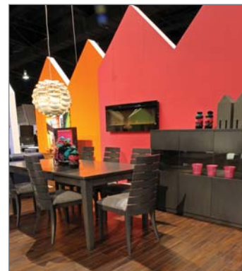
Vignette tendance au SCAR - Collection Kosmo, 1222 Black Walnut.

D'Anjou, qui a déjà travaillé chez Beaulieu Canada pour repenser l'image Your HomeStyle, avait choisi des revêtements de Beaulieu pour sa vitrine. Les laminés Pür et Kosmo, le revêtement résilient Karisma et le tapis H825 Mystical Lake Front de